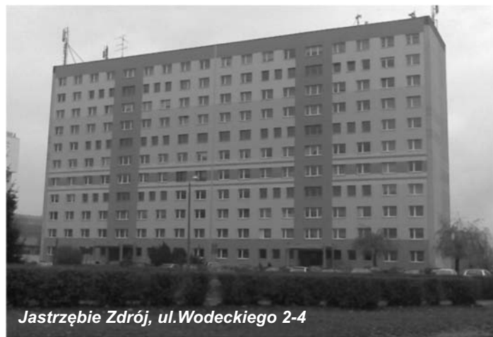
Jastrzębie Zdrój, ul. Wodeckiego 2-4

budynkach wysokich dodatkowo wnętrza międzyloggiowa co w znacznym stopniu poprawiło estetykę elewacji balkonowej budynków.