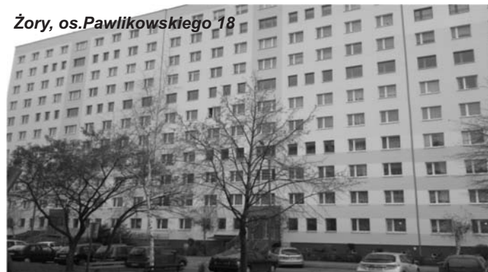
Żory, os. Pawlikowskiego 18

Aby obniżyć zużycie ciepła i poprawić komfort cieplny budynków nasza spółdzielnia przystąpiła do prac remontowych polegających na ociepleniu ścian frontowych.