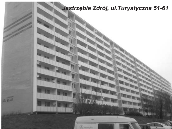
Jastrzębie Zdrój, ul. Turystyczna 51-61

W roku 2009 największymi inwestycjami były remonty balustrad balkonowych oraz wykonanie ociepleń budynków. W związku z dużym zainteresowaniem pracami remontowymi polegającymi na wymianie balustrad balkonowych na terenie Jastrzębia Zdroju, prowadzonymi w 2008 r. Spółdzielnia Mieszkaniowa „Nowa”