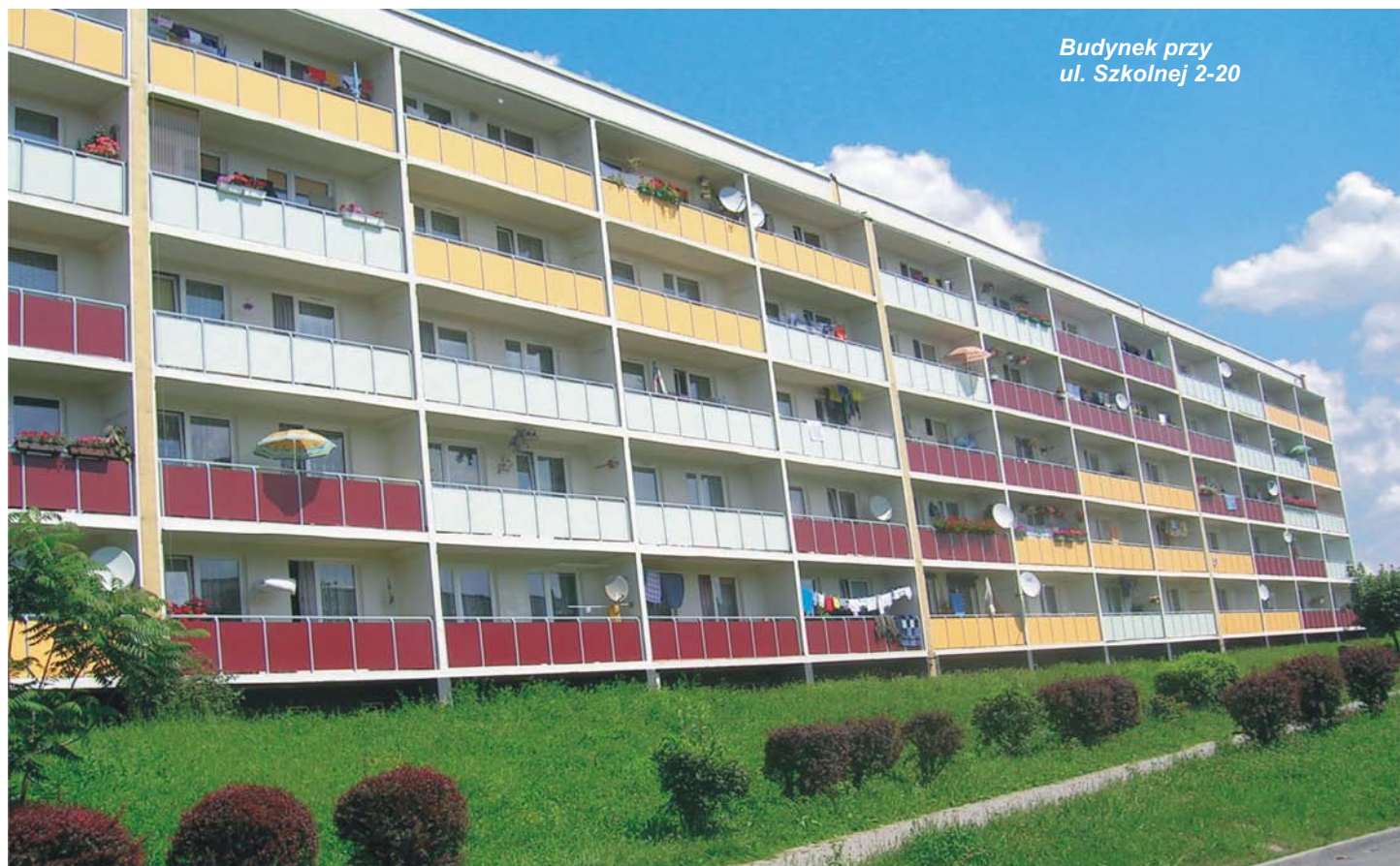
Budynek przy ul. Szkolnej 2-20