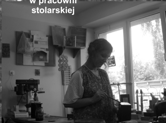
Zajęcia w pracowni stolarskiej