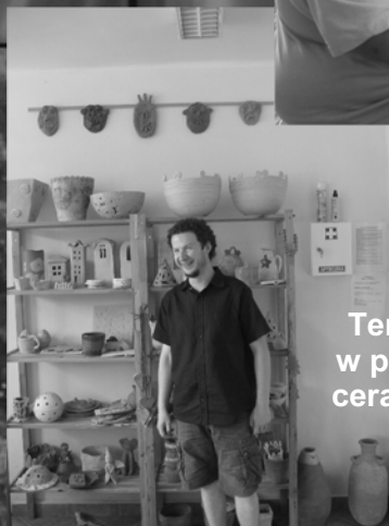
Terapeuta w pracowni ceramicznej