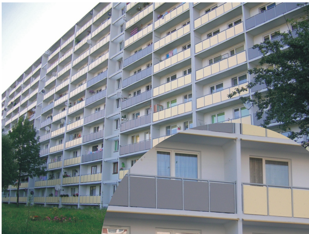
Budynek przy ul. Wielkopolskiej 1-15 (zbliżenie na balkony)

W Jastrzębiu koszty pomniejszane są dodatkowo o dotację z Urzędu Miasta na prace związane z demonstacją, usunięciem i unieszkodliwieniem azbestu. Na