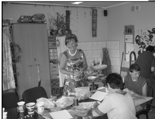
Kierowniczka WTZ z podopiecznymi w pracowni biżuterii i florystyki