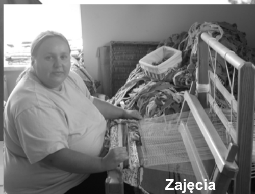
Zajęcia w pracowni tkactwa i makramy