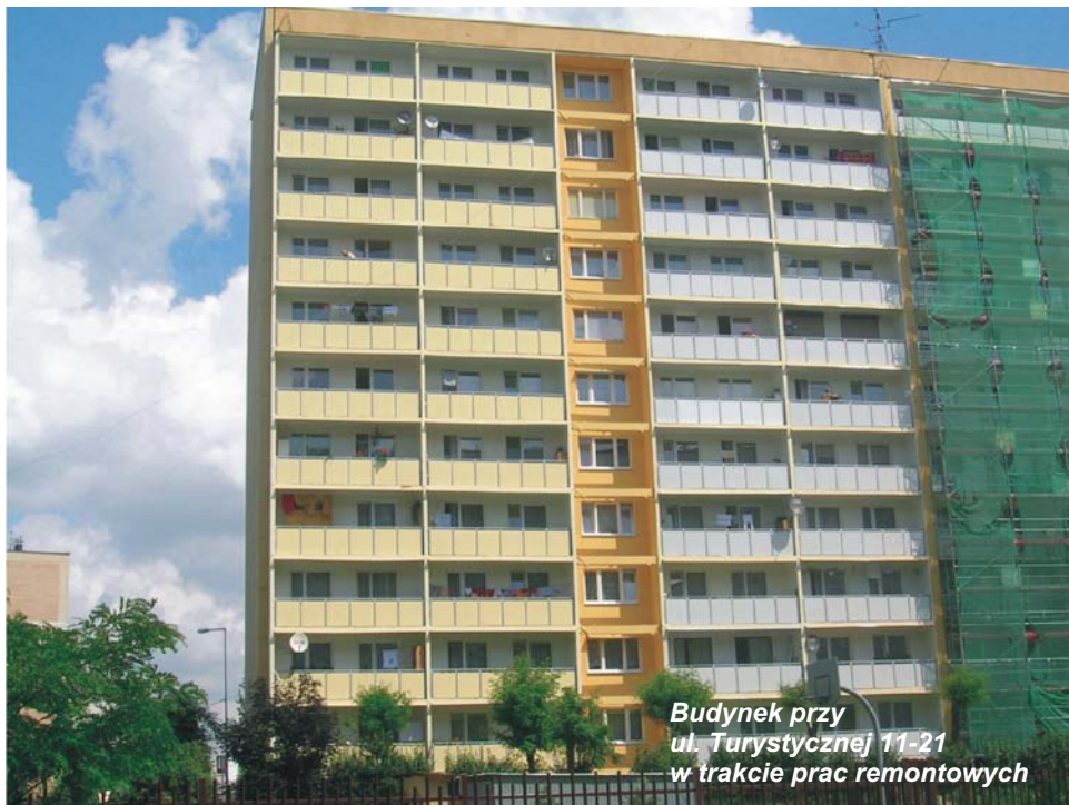
Budynek przy ul. Turystycznej 11-21 w trakcie prac remontowych

Mieszkańców, którzy mają ochotę pomóc przy przeprowadzaniu kolejnych referendów, prosimy o zgłoszenie się do administracji osiedlowej lub do siedziby spółdzielni.