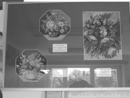
Wystawa prac wykonanych w pracowni tkaniny artystycznej