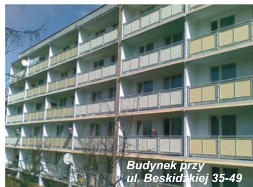
Budynek przy ul. Beskidzkiej 35-49

Zgodnie z planem, na koniec roku powinny być wykonane remonty łącznie na 17 budynkach w Jastrzębiu oraz na 2 budynkach w Żorach.