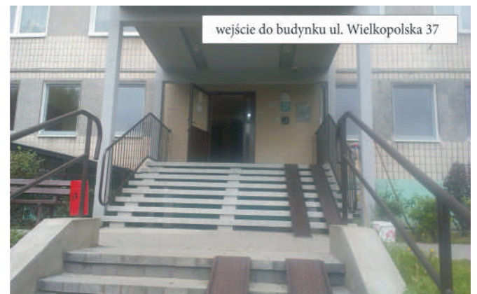
wejście do budynku ul. Wielkopolska 37