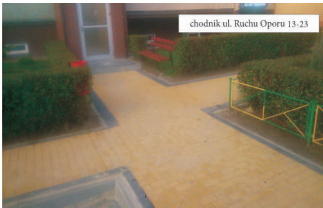
chodnik ul. Ruchu Oporu 13-23