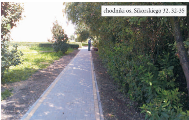
chodniki os. Sikorskiego 32, 32-35