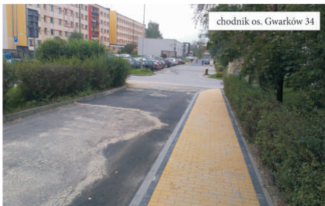
chodnik os. Gwarków 34