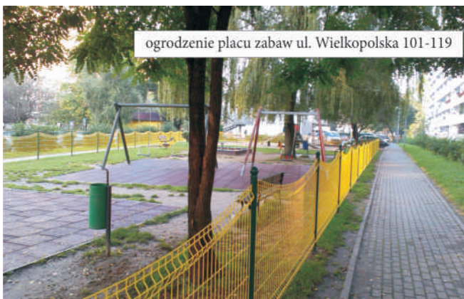
ogrodzenie placu zabaw ul. Wielkopolska 101-119