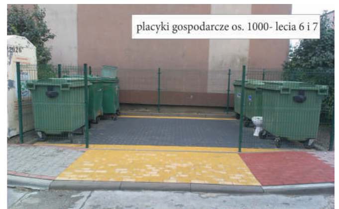
placiki gospodarcze os. 1000-lecia 6 i 7