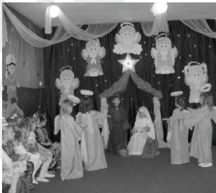
Zdjęcia z noworocznego spotkania jasełkowego.