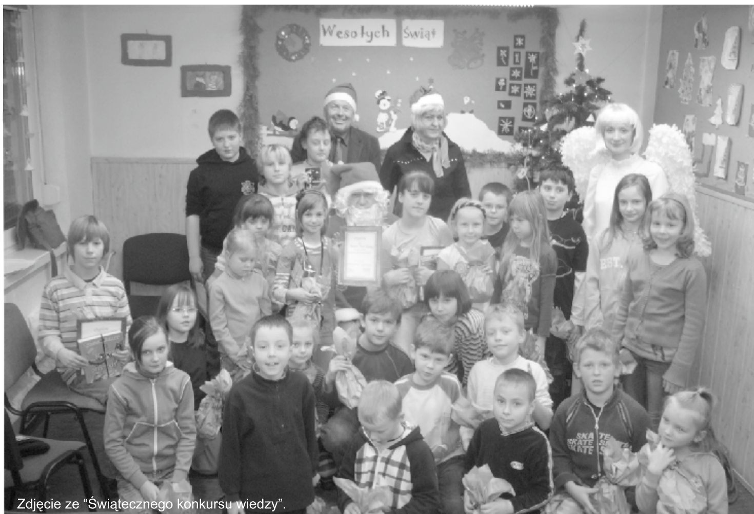
Zdjęcie ze „Świątecznego konkursu wiedzy”.

II. Dziękujemy bardzo Dyrektorowi, gronu pedagogicznemu oraz dzieciom za zaproszenie Publicznego Przedszkola nr 6 w Jastrzębiu Zdroju za zaproszenie na noworoczne spotkanie jasełkowe , które odbyło się w dniu 14.01.2011r. Gratulujemy ogromnego zaangażowania w przygotowaniu przedstawienia na naprawdę profesjonalnym poziomie. Mali artyści pod kierunkiem swoich