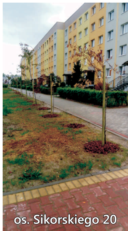
os. Sikorskiego 20