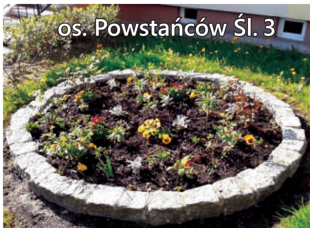
os. Powstańców Śl. 3