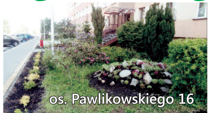
os. Pawlikowskiego 16